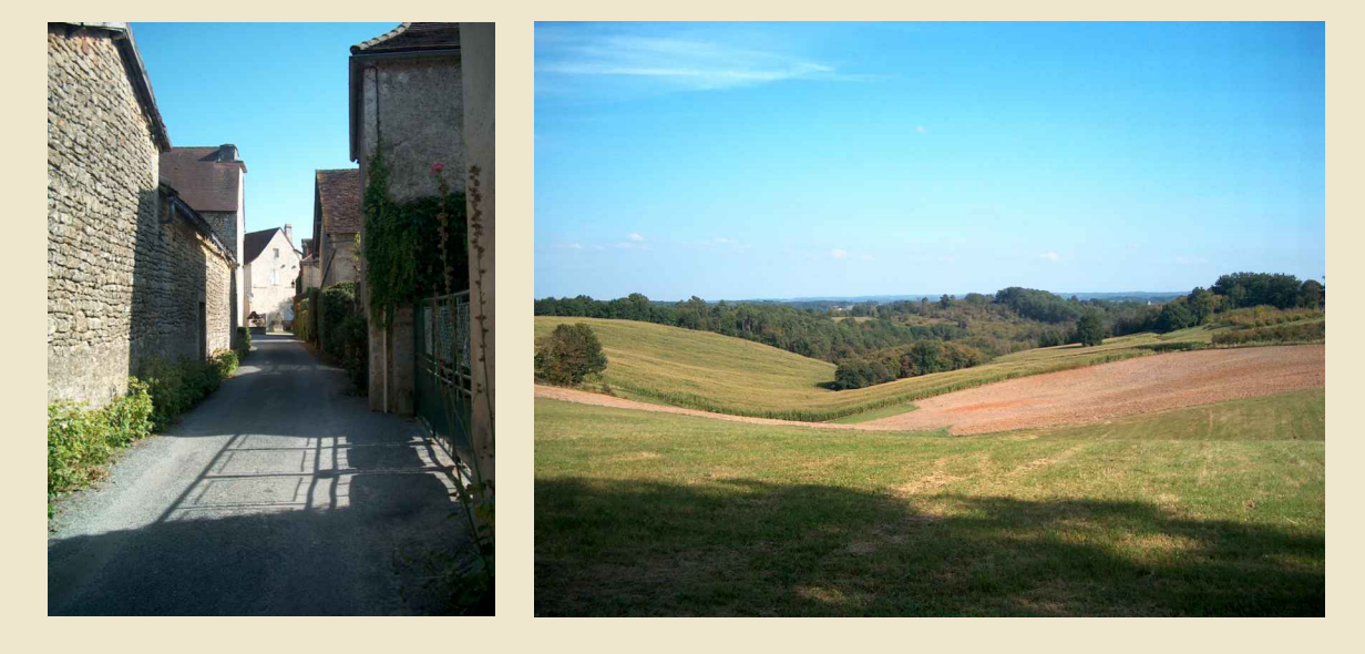
Plan Local d'Urbanisme approuvé par délibération du Conseil Municipal le 07 FEVRIER 2012